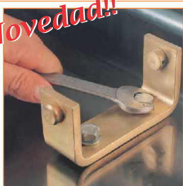
Soporte especial para fijación rápida