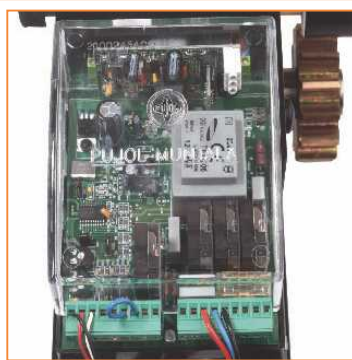
Versión monofásica con equipo incorporado