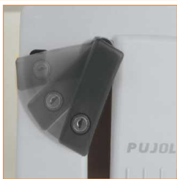
Desbloqueo manual: ABRIR, TIRAR, GIRAR