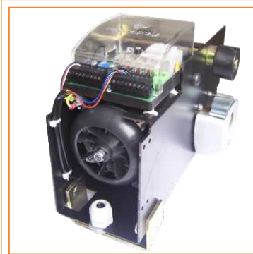
Motoreductor autoventilado de gran robustez. Encoder para el control electrónico de la velocidad y ajuste de la fuerza antiplastamiento.