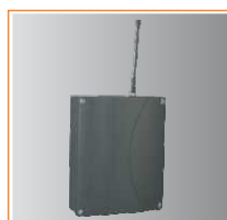
Master Marathon trifásico