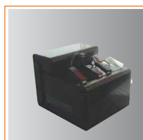
Kit cargador + batería + soporte