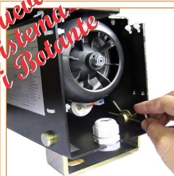
Sistema basculante patentado. Absorbe las irregularidades de la guía y la cremallera facilitando la instalación