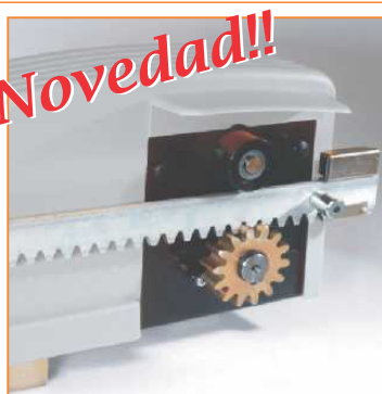
Piñón y rodillo de apoyo para guiar la cremallera